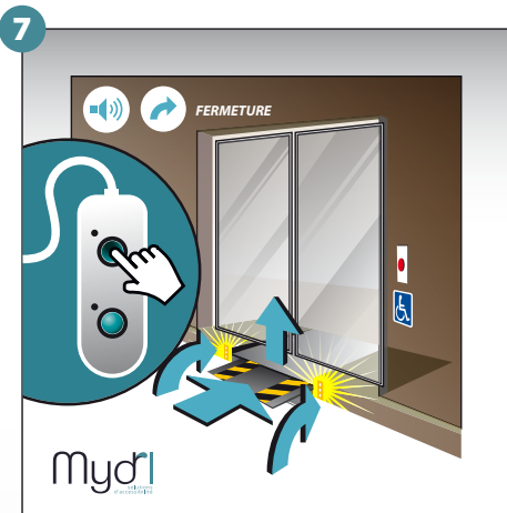
7 - Un fois la porte fermée, fermeture des rampes avec un signal sonore et visuel. Maintenir la pression jusqu'à la fermeture totale des rampes.