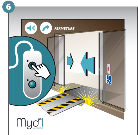
6 - Fermeture de la porte et début de la fermeture des rampes avec signal sonore et visuel. Appuyer sur le bouton haut en pression continue.