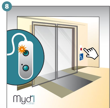
8 - Bouton d'appel à l'intérieur pour la manoeuvre d'ouverture des rampes et de la porte. Fermeture totale des rampes et du volet voyant fin de course haut allumé.