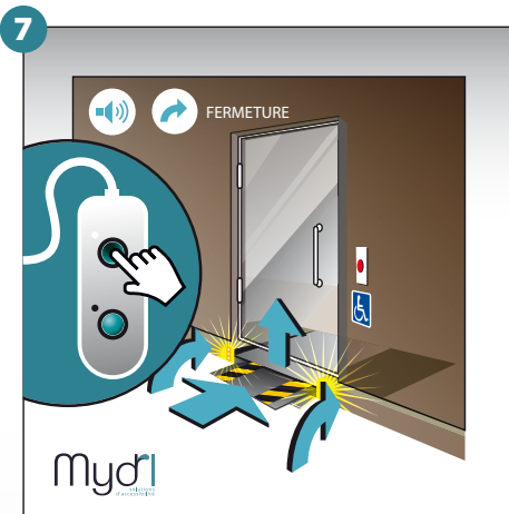
7 - Un fois la porte fermée, repli des rampes avec un signal sonore et visuel, puis déverrouillage de la porte. Maintenir la pression jusqu'à la fermeture totale des rampes.