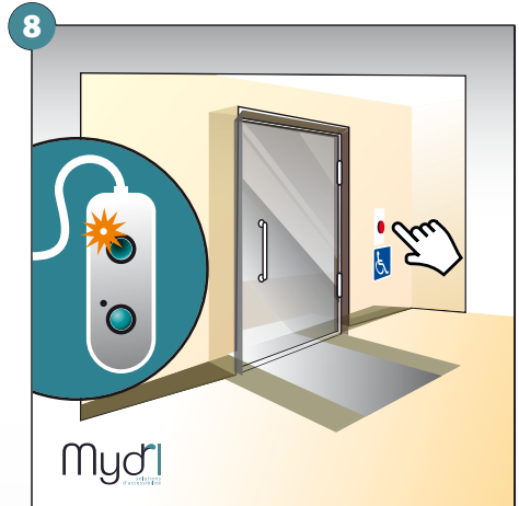
8 - Bouton d'appel à l'intérieur pour la manoeuvre d'ouverture des rampes et de la porte. Fermeture totale des rampes et du volet voyant fin de course haut allumé.