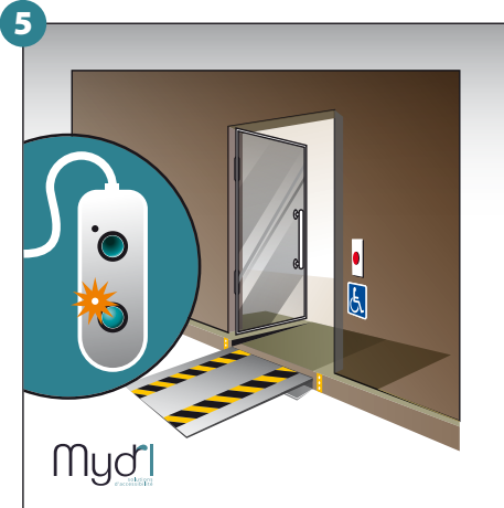
5 - Porte ouverte et rampes en service. La personne en fauteuil entre.