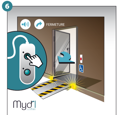
6 - Fermeture et verrouillage de la porte, début de la fermeture des rampes. Signal sonore et visuel actif. Appuyer sur le bouton haut en pression maintenue